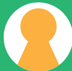
全国ギャンブル依存症家族の会 東京 当事者家族