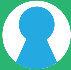
公益社団法人 ギャンブル依存症問題を考える会 当事者支援部 依存症当事者